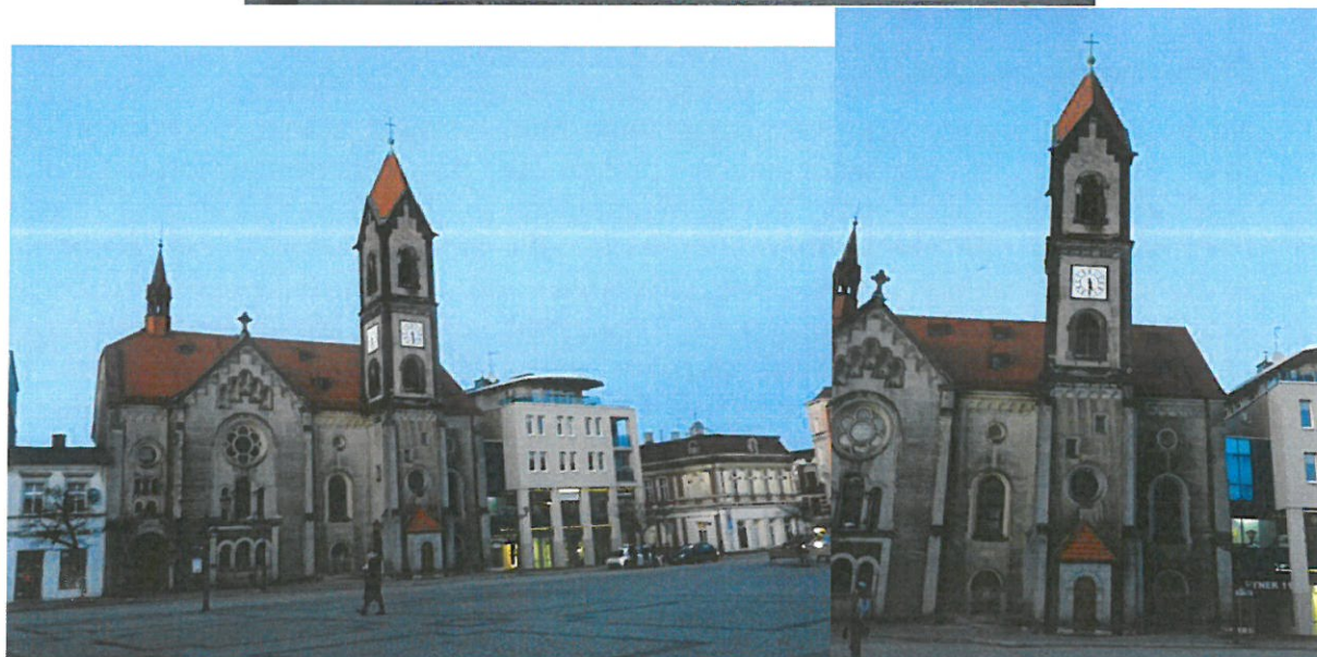
Mapa z zaznaczonymi kierunkami i punktami pomiarowymi